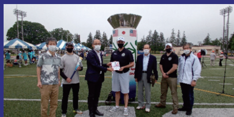
Support USAF members to organize local activities "Special Olympics"