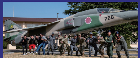
Support Japan-U.S. Bilateral NCO Exchange Program