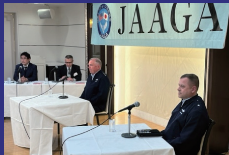
Lecture by Commanders and Generals of Koku-Jieitai and USAF