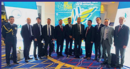
Participate in AFA general meeting