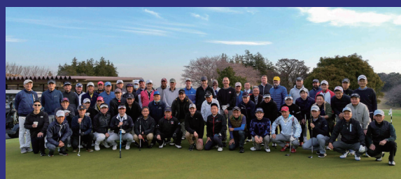
Conduct friendship golf competition "SPORTEX"