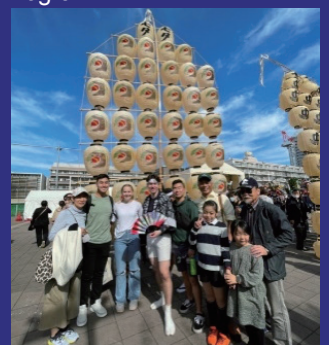
Support USAF members in their study of Japanese culture