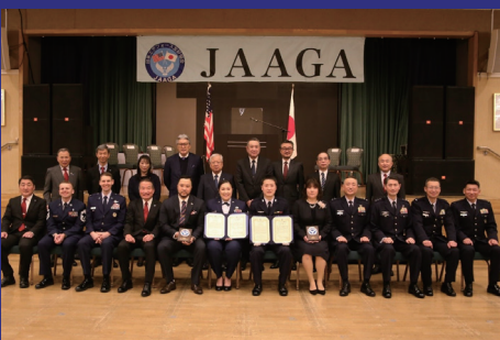
Commend Koku-Jieitai & USAF Brilliant Airmen