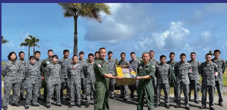
Encourage participants in overseas joint trainings