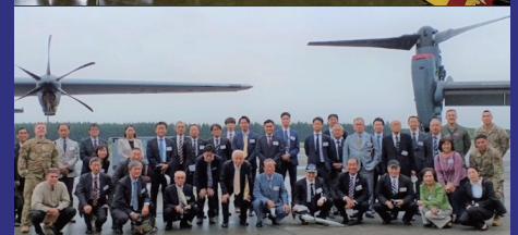
Conduct study tours of USAF Base in Japan